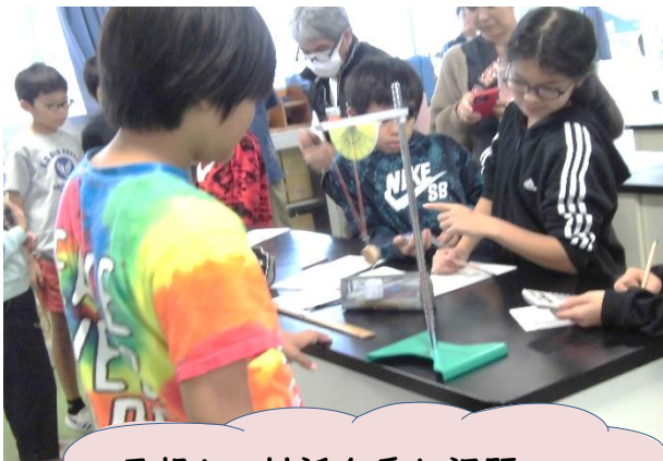
予想し、対話を重ね課題を解決していきます♪

『一往復が一秒になる長さをみつけよう!』と子供たちはこれまでの学びを想起しながら試行錯誤して実験を進めました。振り子の長さを少しずつかえ、ストップウォッチで10秒計り、計算して一秒に限りなく近づく長さを探しました。