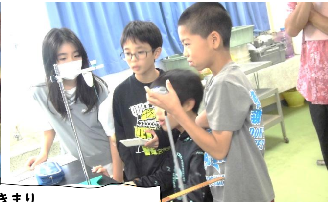
ふりこのきまり これまでの学習を活かして一秒時計を作ろう